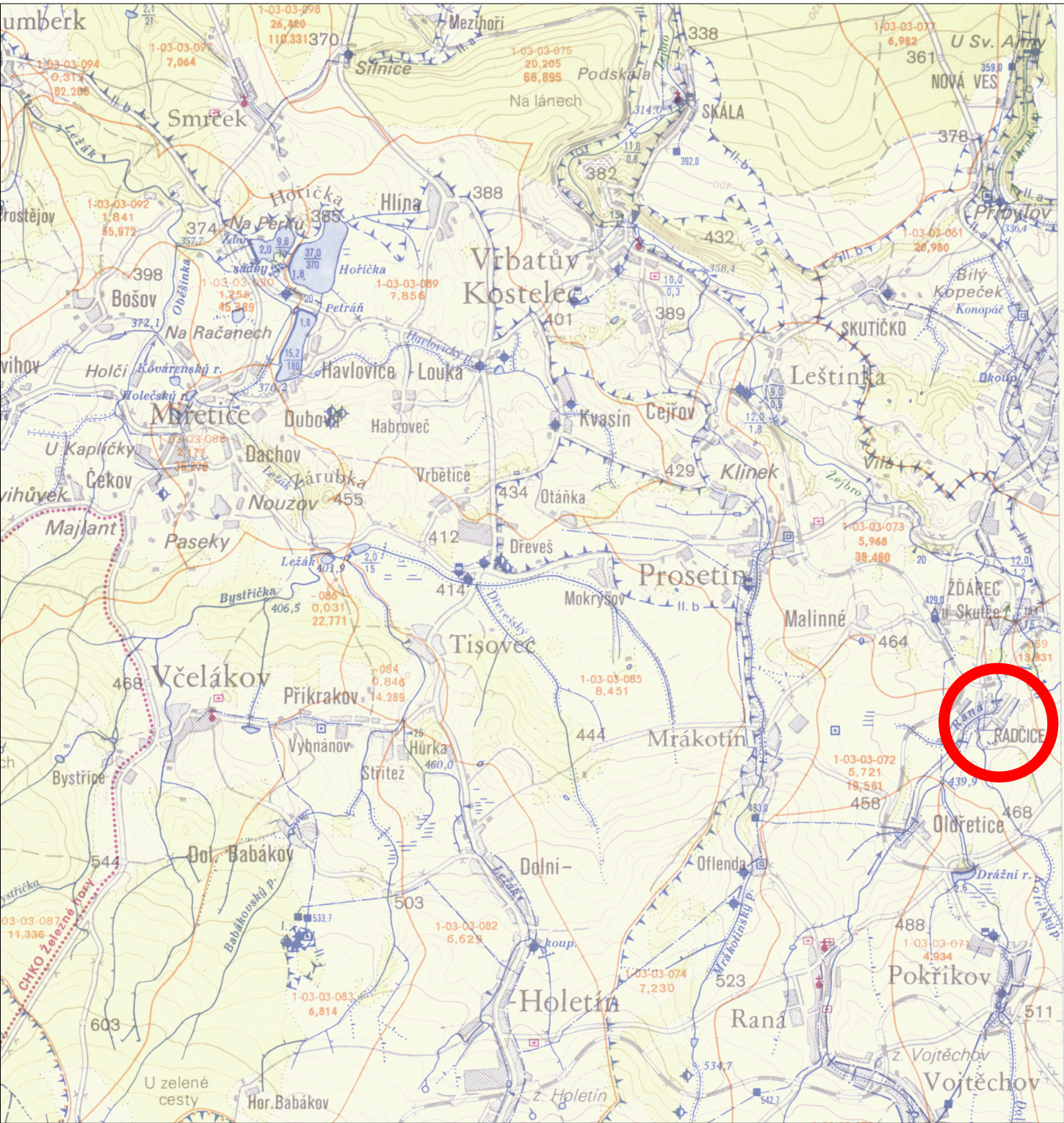
ZVHM 13–44 Hlinsko